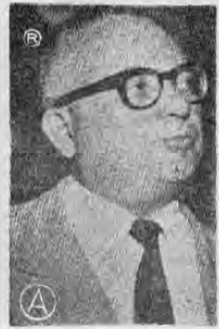
Presidente BETANCOURT...enfrenta con decisión el ataque rojo...

CARACAS, 19. AP.—El Ministro de Defensa Antonio Briceño Linares y el resto del alto mando de las fuerzas armadas efectuó una visita sin precedentes a la sede de la Confederación de Trabajadores Venezolanos.