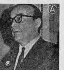
Presidente GUIDO ...controla una ola de sabotajes en acueductos...

BUENOS AIRES, 19. AP — El gobierno ordenó hoy a las fuerzas armadas operar y proteger los servicios de agua de esta capital, al declararse en huelga los trabajadores.