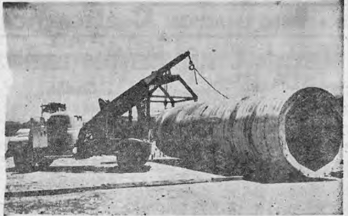
MATERIAL ESENCIAL PARA LA PLANTA DE RIO MACHO. Puede apreciarse en esta fotografía una sección del blindaje de acero para el Túnel N° 3 (conducido a presión). El túnel tendrá suficiente capacidad de conducción para abastecer la capacidad generadora que se instalará

tomado ninguna decisión todavía, pero el criterio que prevalece es que autorizar el cierre a las 10 de la noche de esos negocios, es consentir en una competencia desleal contra los que pagaron patentes especiales para instalarse en el propio lugar de las Fiestas. Además, argumentan que el movimiento aumentará grandemente en el Parque Infantil González Viquez durante estos días de Fiestas, y que las 6 de la tarde es insuficiente para que estos comerciantes disfruten de la afluencia de gente que habrá a fines de año en este sector.