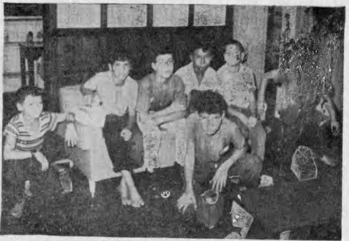
Los representantes de un grupo mayor de cincuenta ilustradores de zapatos, estuvieron ayer, en nuestra relación, a fin de anunciar oficialmente que a partir de hoy aumentarán a setenta y cinco